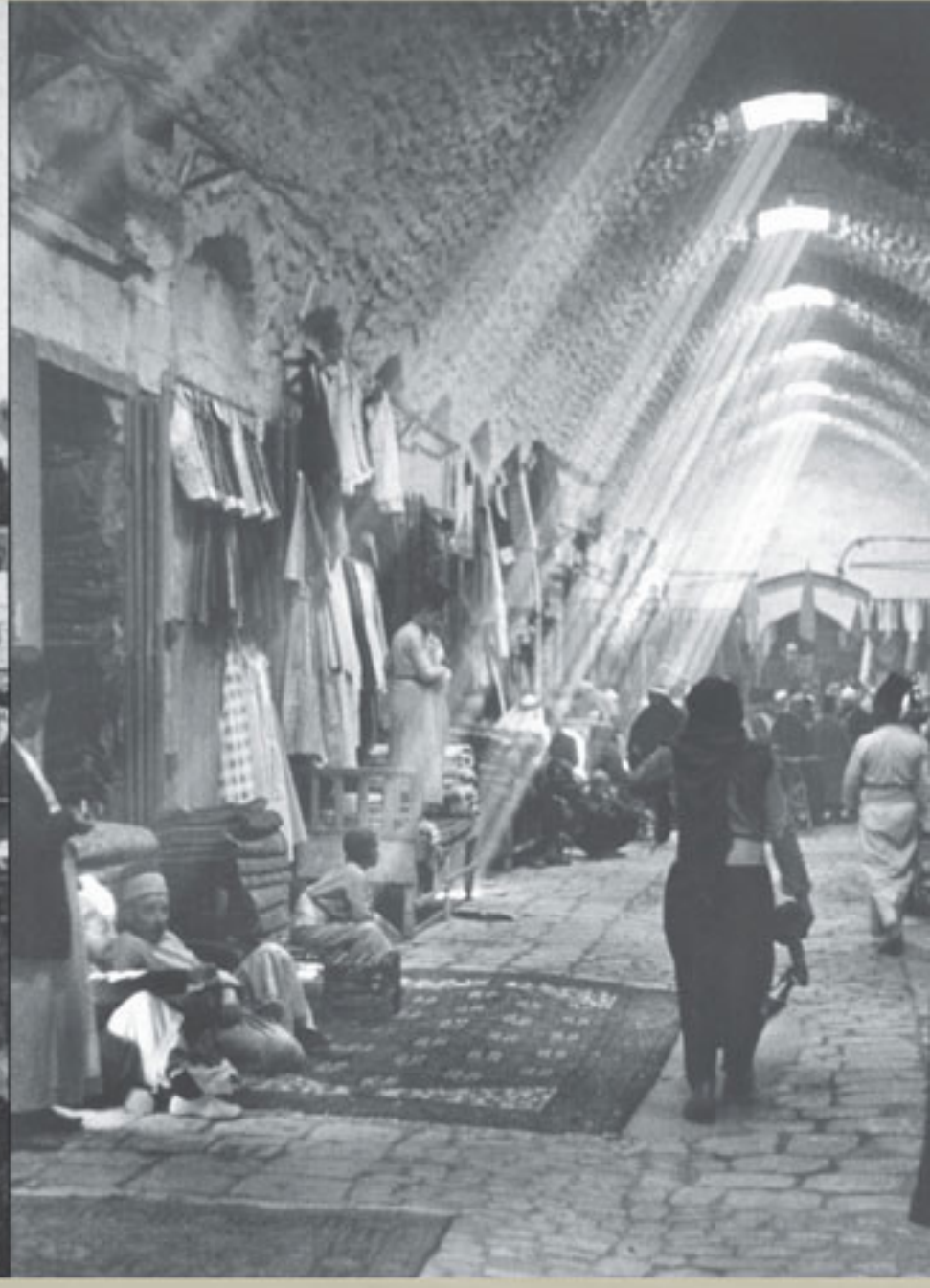
صور تاريخية لأسواق المدينة والقلعة Historic photos of the Souk Medina and the Citadel