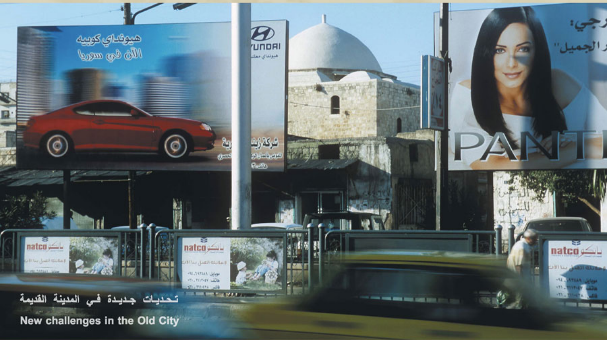
تحديات جديدة في المدينة القديمة New challenges in the Old City