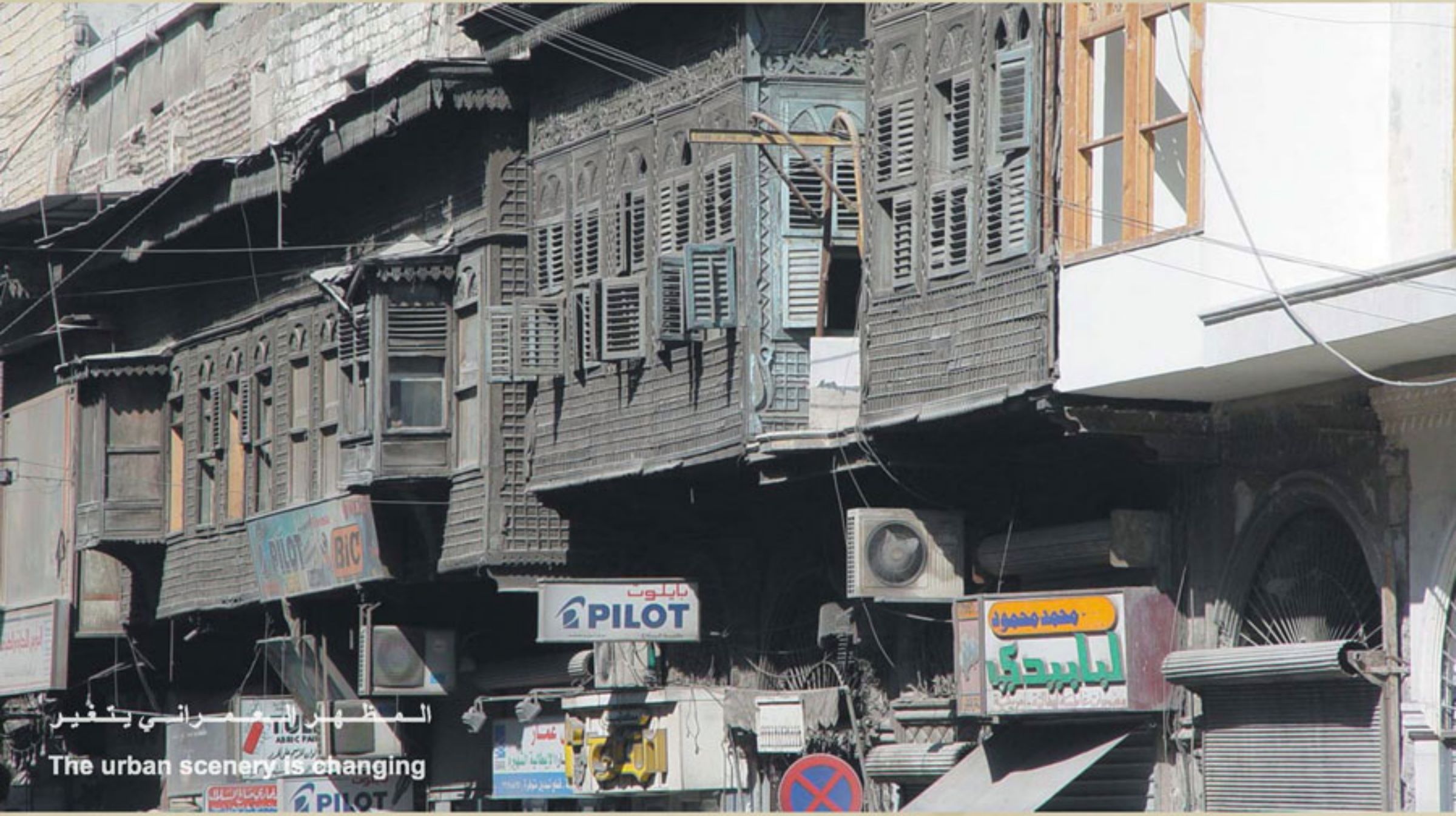
المظهر العمراني يتغير The urban scenery is changing