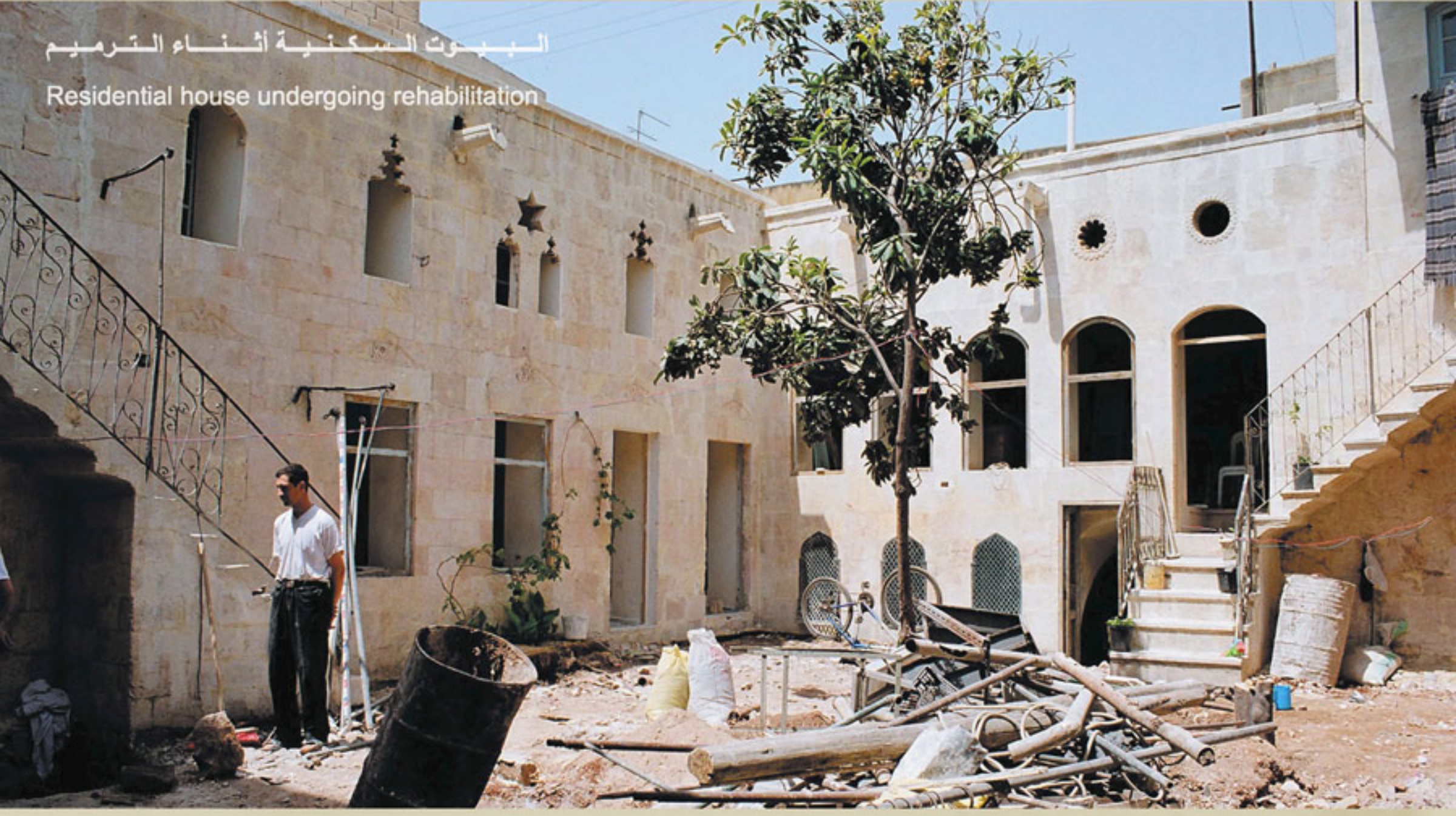
البيوت السكنية أثناء الترميم Residential house undergoing rehabilitation

تحتاج ثلث البيوت في المدينة القديمة البالغ عددها ١٠,٠٠٠ بيت خاص إلى أعمال ترميم ضرورية لحمايتها من التدهور والهجر. إن القروض الصغيرة المقدمة بدون فائدة والاستشارات الهندسية المجانية والإعفاء من الرسوم البلدية تمكن السكان ذوي الدخل المحدود من صيانة بيوتهم. إن الترميم الناجح المنفذ وفق الخطوط التوجيهية للبناء ضمن النسيج العمراني التاريخي ومعايير التنفيذ الدولية يشجع الجوار أيضاً على إجراء أعمال الصيانة والترميم في بيوتهم.