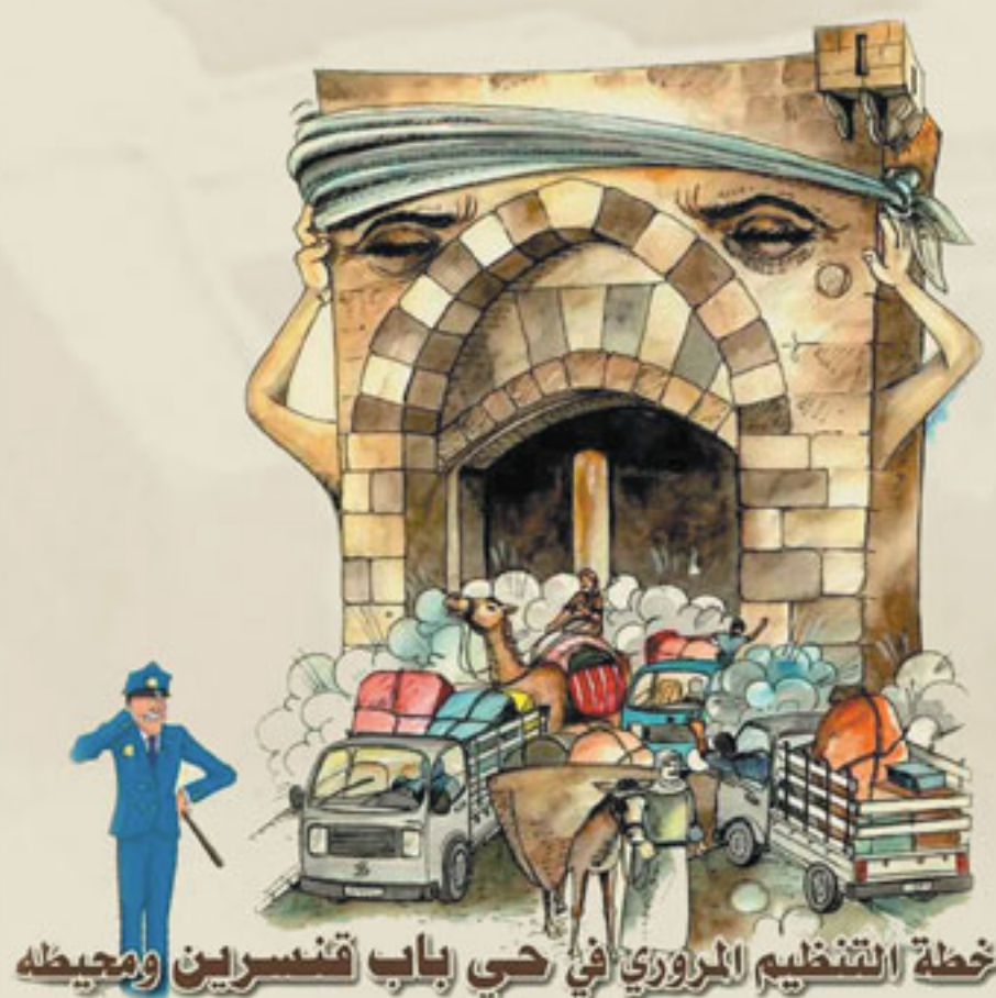
خطة التنظيم المروري في حي باب قنسرين ومحيطه

كتيب يُطلع السكان على خطة الإدارة المرورية في منطقة باب قنسرين. A booklet informs the residents about the traffic management plan in the Bab Qinesreen Area.