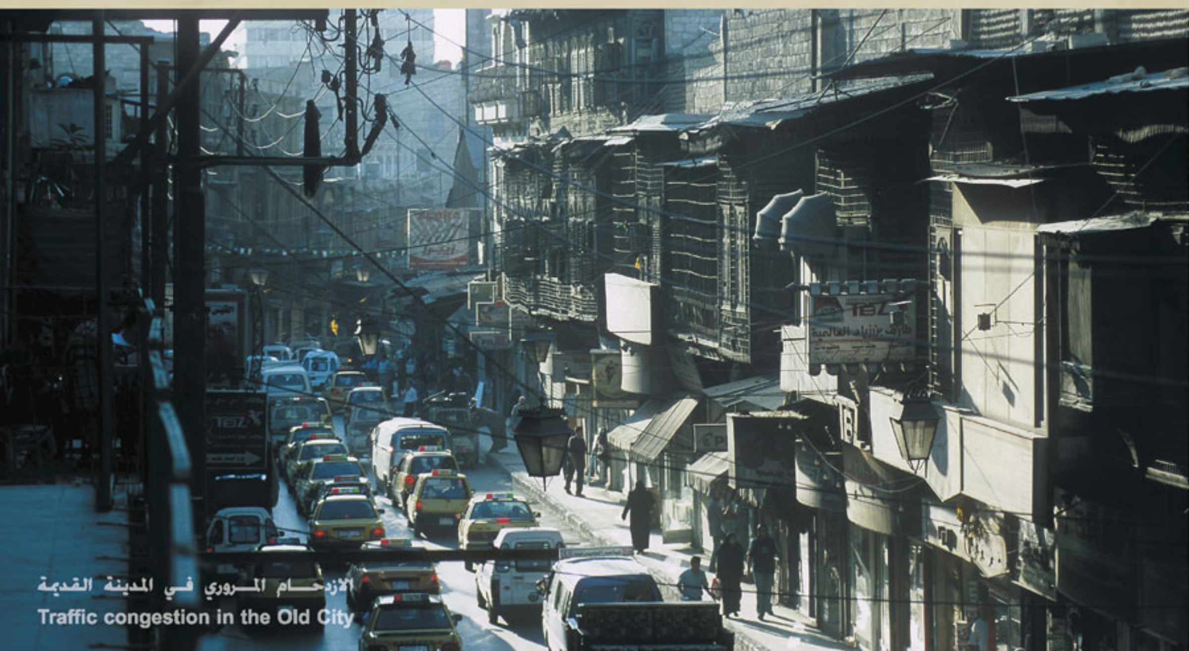
الازدحام المروري في المدينة القديمة Traffic congestion in the Old City

سيتم تطبيق المخطط الشامل للمرور في المدينة القديمة بالتدريج حتى عام ٢٠١٠، حيث يهدف إلى تجنب المرور العابر وتحقيق إمكانية الوصول بشكل جيد إلى كل المناطق. إن إجراءات تخفيض الضغط المروري بواسطة خلق مسارات جديدة وتحسين خدمات النقل العام ومنح أفضلية المرور للسكان والتجار والزبائن و تخفيض تلوث الهواء والضجيج. وبهذه الطريقة يتم توفير الراحة والأمان بشكل تدريجي في شوارع المدينة القديمة. لا يمكن تخديم العديد من المواقع في المدينة القديمة بسبب ضيق الأزقة. لذلك يتم تأمين مواقف للسيارات على مسافة لا تزيد عن ٣٠٠ م عن أي منطقة في المدينة القديمة.