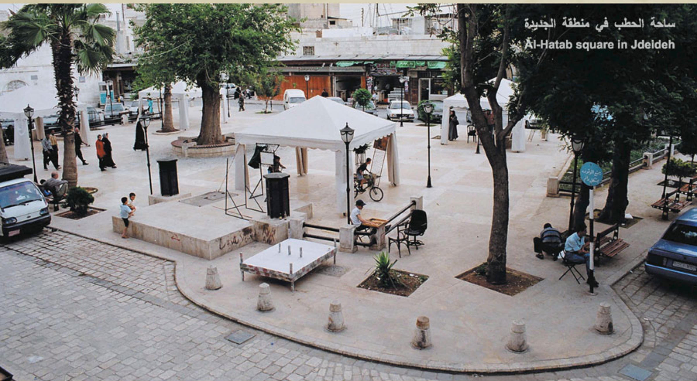
ساحة الحطب في منطقة الجديدة Al-Hatab square in Jdeideh

يهدف تحسين الفراغات العامة إلى رفع سوية البيئة العامة للحياة اليومية والنشاطات الاجتماعية. يمكن إحياء وتنشيط حي بأكمله عن طريق تأسيس ساحة عامة جميلة وهذا لا يساعد على زيادة اهتمام السكان بحيهم فقط بل يحسن صورة المدينة القديمة أمام زائريها وبالتالي يشجع على جذب التمويل الخاص والعام.