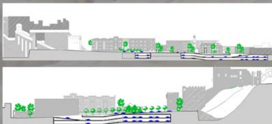
Land use proposal